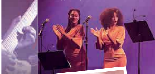
Hommage Aretha Franklin