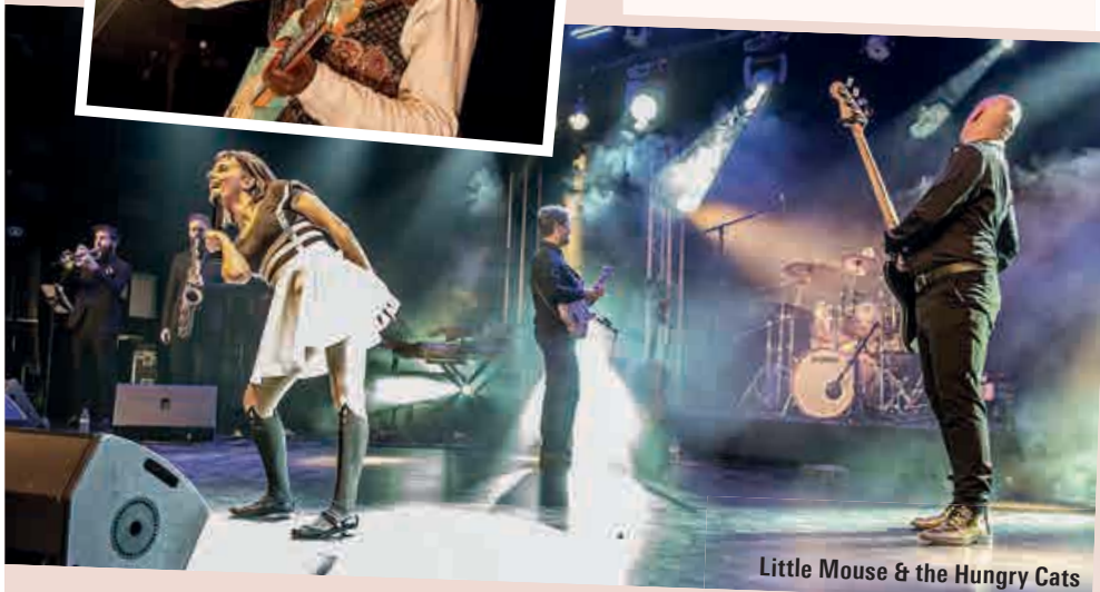
Little Mouse & the Hungry Cats

CETTE ÉDITION RESTERA À COUP SÛR DANS LES MÉMOIRES AVEC UNE PROGRAMMATION QUI A TENU TOUTES SES PROMESSES ET UNE ÉQUIPE AU TOP !