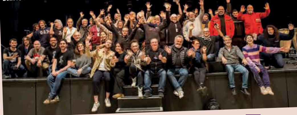
Bénévoles de Blues-sur-Seine