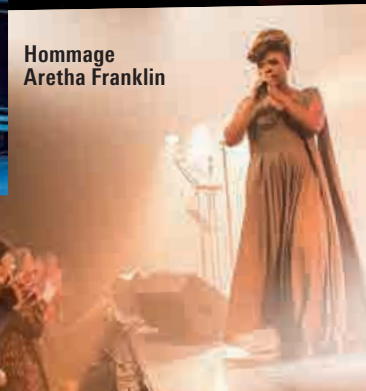
Hommage Aretha Franklin