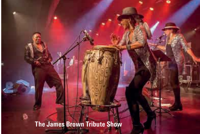
The James Brown Tribute Show