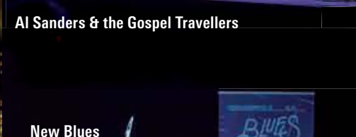
New Blues Generation